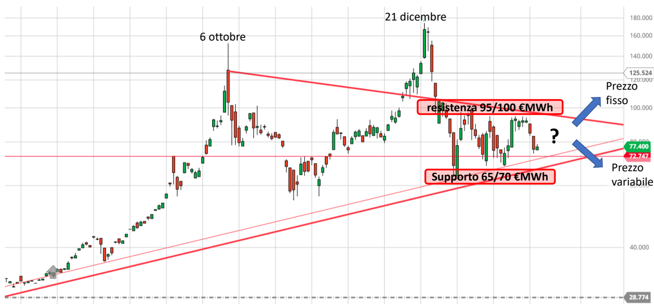
Figura 3: Quotazioni giornaliere Gas (TTF), consegna febbraio 2022.

ultimi due impulsi rialzisti, si osserva un consolidamento delle quotazioni nel range compreso tra 60 €/MWh e 100 €/MWh negli ultimi tre mesi.